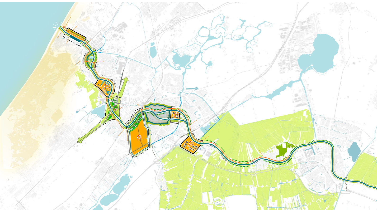
Projectenkaart Oude Rijn (uit 'Verslag kwartiermakersfase Landschapspark Zuidvleugel', Defacto)