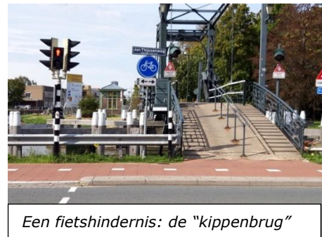
Een fietshindernis: de "kippenbrug"

Helaas is er nog steeds geen bestemmingsplan. Slechts een verouderde beheersverordening en nog steeds een niet nader gedefinieerde 'transformatiezone'. Vlietrand Groen blijft dan ook vragen om een samenhangend, groen plan voor het gebied met aandacht voor cultuurhistorische kwaliteiten, het vogelreservaat, de schitterende landgoederen, de slagenlandschappen, de weilanden en de voor iedereen toegankelijke volkstuinten. Aanleg van mooie fietsroutes en wandelpaden en door meer culturele recreatie op en langs de Vliet.